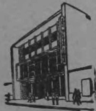
Fundado en 1925

Hay un modelo para Usted! Verdadera ganga en precio y condiciones